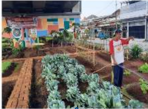
Bawah Jalan Tol