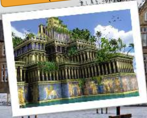
Taman Gantung Mesopotamia (Irak Kuno)