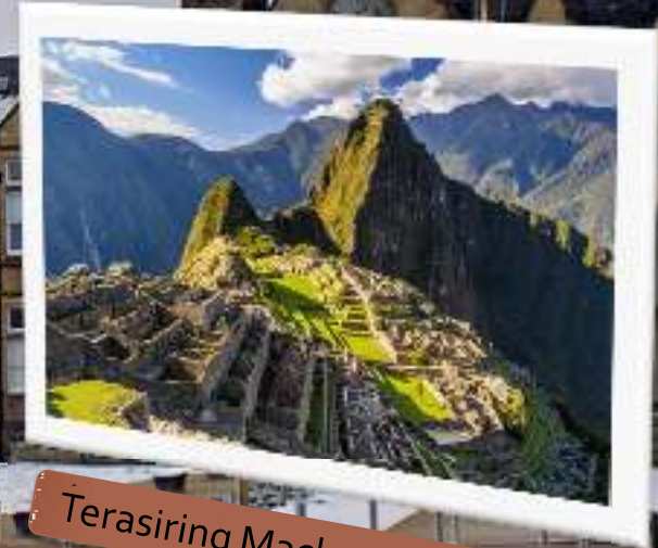
Terasiring Machu Picchu Peru