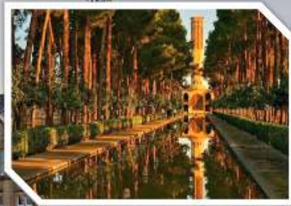
Wall Gardening Persia Kuno